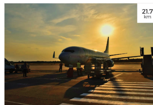
6 مطار الشارقة الدولي Sharjah International Airport