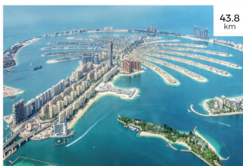
8 جزيرة النخلة - دبي Palm Jumeirah

The "Al Qasba Towers and Mall" project is strategically located adjacent to Al Qasba Canal, a renowned tourist landmark in the emirate. Situated within one of Sharjah's most vibrant and modern areas, this prime location has experienced remarkable growth in both tourism and real estate development over the past years.