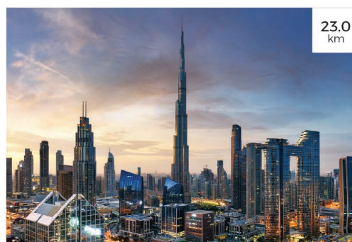
7 برج خليفة - دبي Burj Khalifa