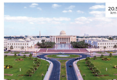
5 المدينة الجامعية بالشارقة University City Sharjah